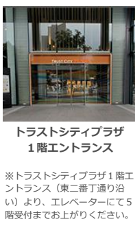
トラストシティプラザ 1階エントランス

※トラストシティプラザ1階エントランス（東2番丁通り沿い）より、エレベーターにて5階受付までお上がりください。